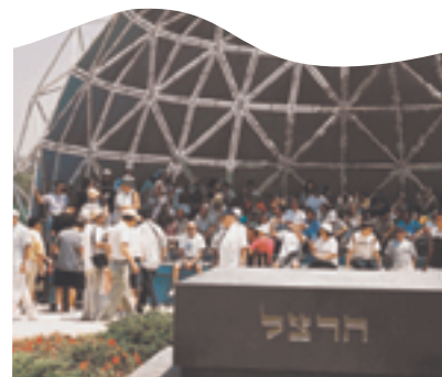
Des touristes français se recueillent sur le tombeau de Herzl

Si d'autres Fédérations Sionistes souhaitent adapter ce projet en fonction de leurs disponibilités, nous les invitons à nous contacter.