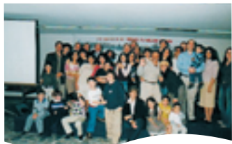
Quelques-uns des 100 olim du Venezuela à la veille de leur aliya