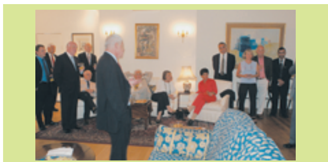
El embajador saliente de Israel en Inglaterra, Zvi Shtauber, (centro, de pie) habla ante un grupo de patrocinadores y miembros de la Federación Sionista de Gran Bretaña en su residencia particular

a Yad Vashem, así como conferencias sumamente interesantes e informativas sobre una vasta gama de temas relevantes, incluida la oportunidad de hablar con el ministro de Turismo, Benny Eilon; una visita al Centro Davidson y los Jardines Arqueológicos; una velada de entretenimiento con la cantante israelí Dganit Dado; y una reunión con el embajador británico en su residencia privada. El viaje terminó con una amena visita al nuevo parque de tema Mini-Israel en camino al aeropuerto Ben Gurión. Los Amigos Cristianos de Israel, con los que la federación viene trabajando durante los últimos cinco años, fueron entusiastas aliados de la iniciativa.