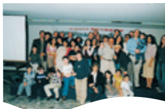
Algunos de los 100 olim de Venezuela en la víspera de su aliá.