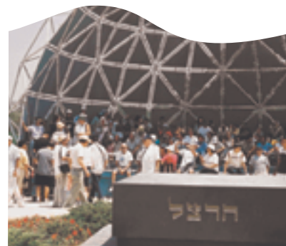
Turistas franceses en la Tumba de Herzl.

Otras federaciones sionistas que estén interesadas en adaptar este proyecto a sus necesidades particulares están invitadas a contactarnos.